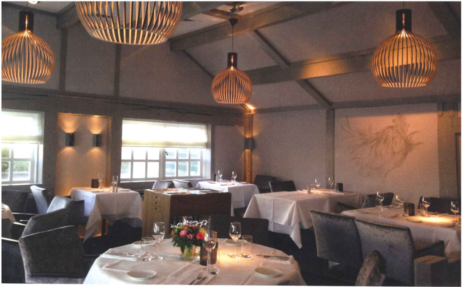
De Jonge Dikkert in Amstelveen. Het van oorsprong klassieke restaurant moest een verrassende en vernieuwende twist krijgen om ook een jongere doelgroep aan te trekken.

‘Al bedenk je zóiets moois; als het na driekwart jaar sleets is, wordt niemand daar blij van’