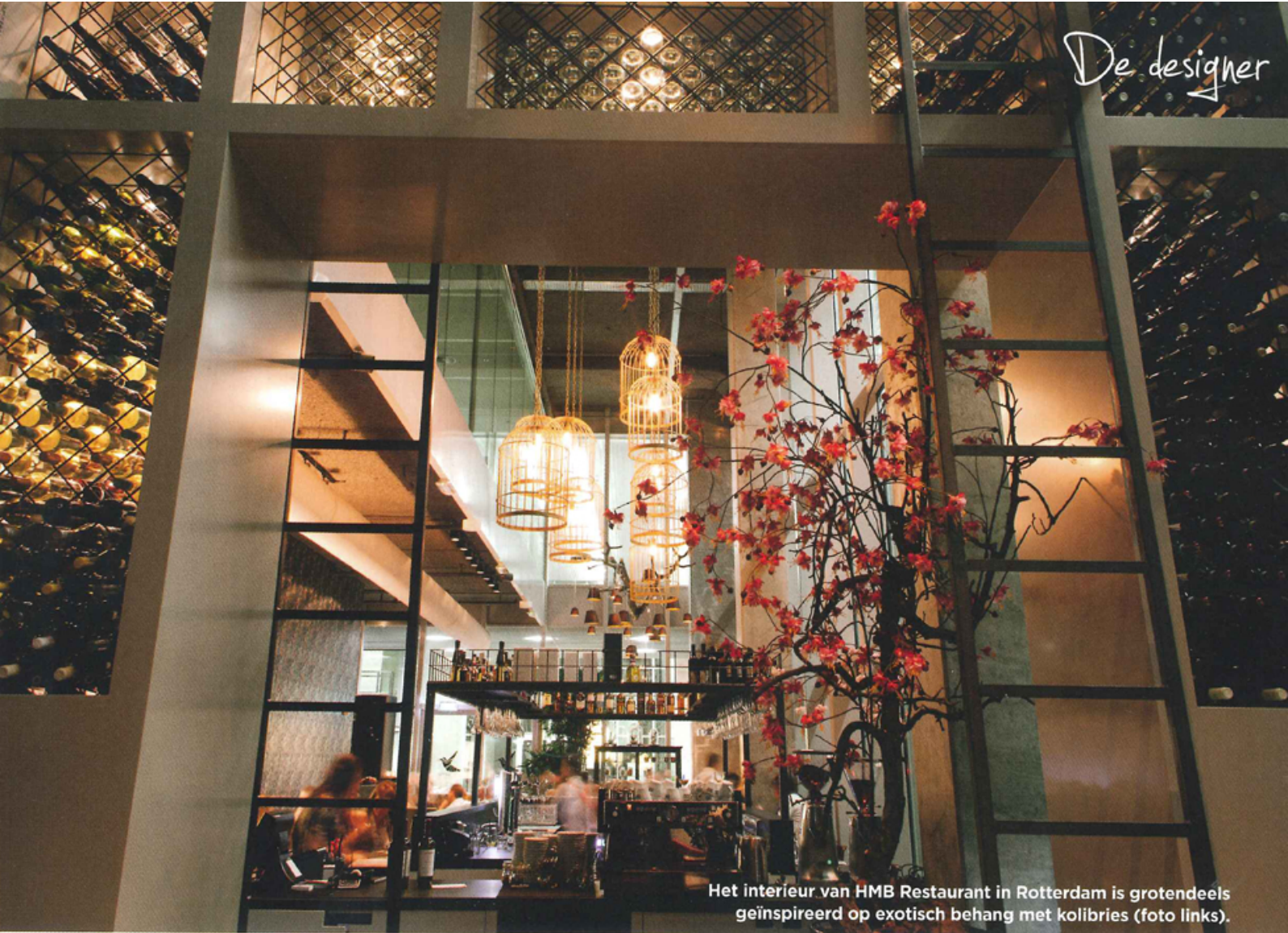
Het interieur van HMB Restaurant in Rotterdam is grotendeels geïnspireerd op exotisch behang met kolibries (foto links).

Y vonne Hoopman richtte achttien jaar geleden het bedrijf Yvonne Hoopman Interior Styling op. Nadat echtgenoot Wim Hoopman ook onderdeel werd van het creatieve bedrijf, veranderde de naam in Hoopman Interior Projects. In 2013 werd een volgende stap gemaakt en kreeg het bedrijf de naam HIP Studio, geleid door Wim Hoopman en zijn dochter Maxine.