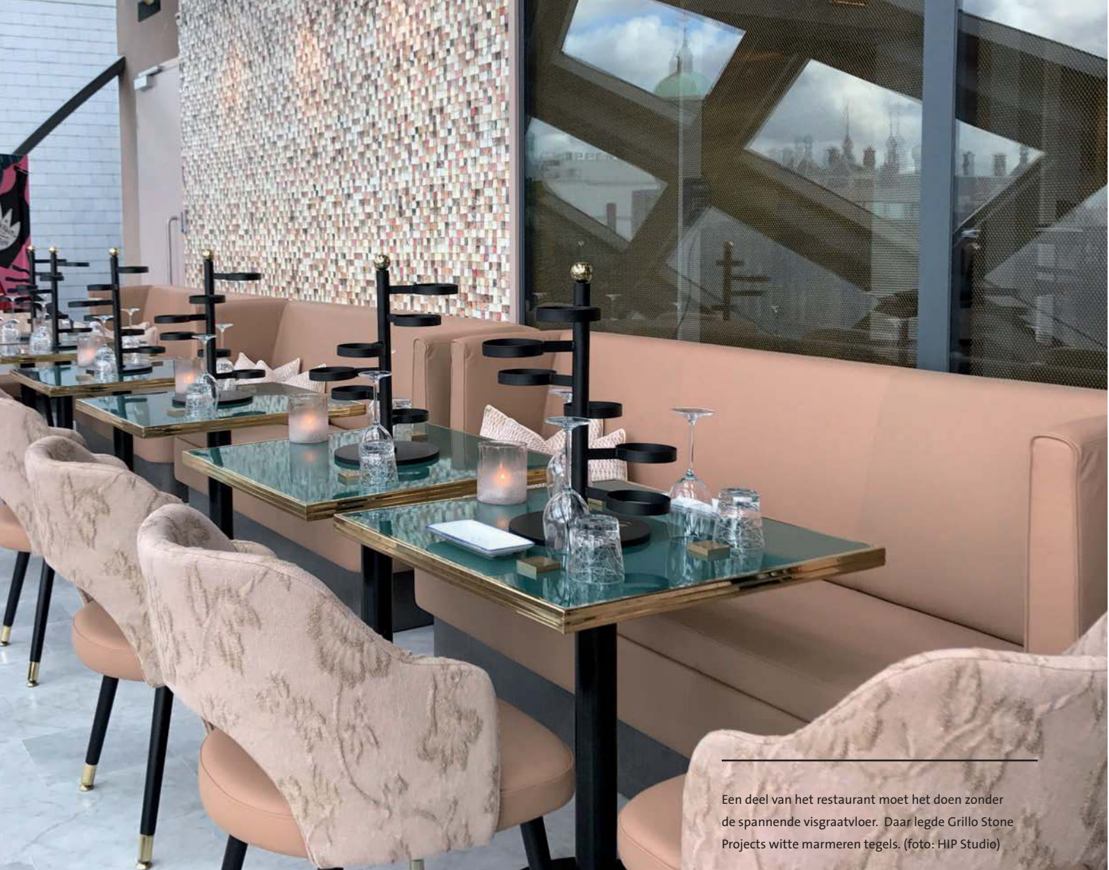
Een deel van het restaurant moet het doen zonder de spannende visgraatvloer. Daar legde Grillo Stone Projects witte marmeren tegels.

“Het echte etsen in het oppervlak van de steen is ook met impregner niet goed tegen te gaan; direct schoonmaken is de enige manier om dat te voorkomen”, zegt Remy Grillo. “Maar zowel opdrachtgever als ontwerper zijn niet onbekend met marmer en kennen de eigenschappen.”